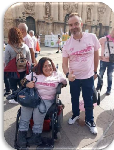
Jaén Se Viste de Rosa