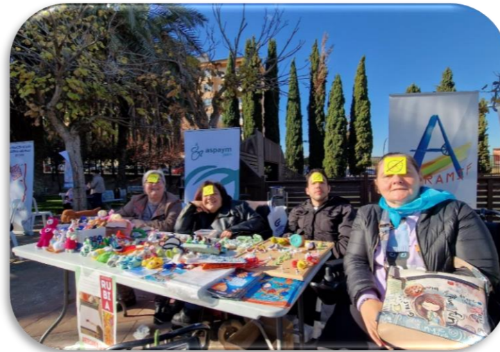
Día Internacional De las Personas con Discapacidad