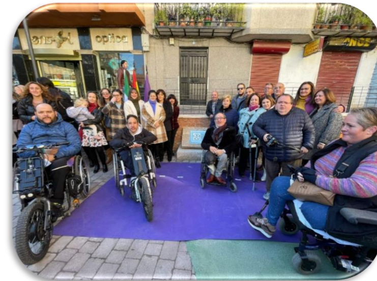
Inauguración Plaza Alfonso Huertas