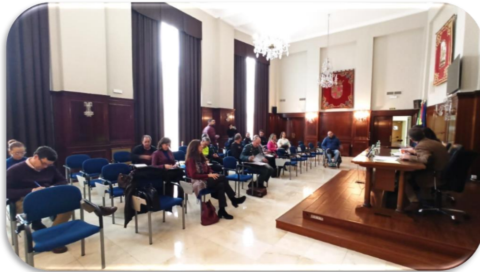
Sub-Comisión Provincial DGT