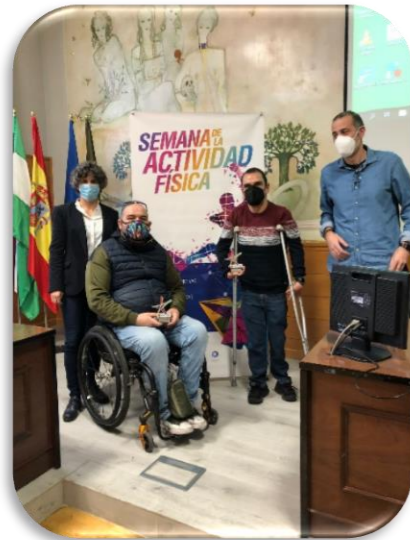
Semana de la Actividad Física Universidad de Jaén.